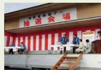
※画像は去年のものです。

消費者感謝デー最大のイベント。抽選券をお持ちの方を対象に抽選を行い、当選された方にその場でプレゼント!! 冷凍マグロや高級メロンなど豪華賞品が目白押し!!