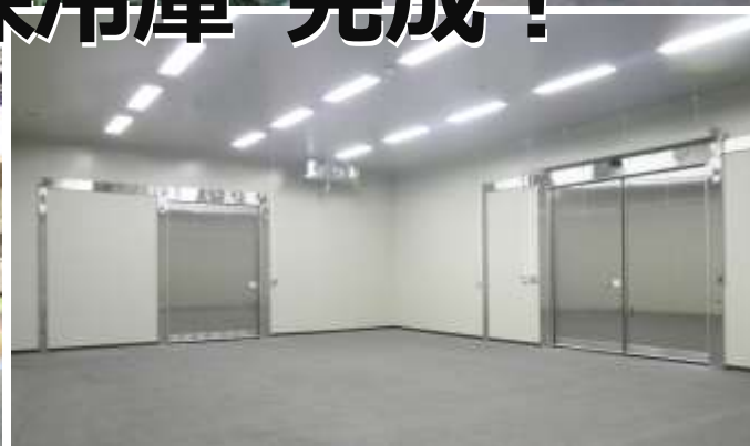
写真上：山梨中央青果（株）低温売場（せり売り時）、下左：（株）甲州青果市場 低温売場、下右：山梨中央青果（株）保冷库内