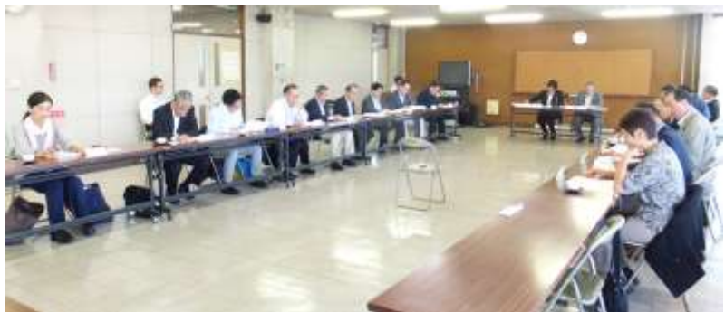
第2回協議会【10月6日】 ※どちらも市場管理事務所